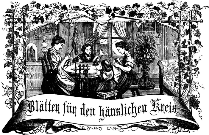
Motto: Immer strebe zum Ganzen, und kannst du selber kein Ganzes werden, als dienendes Glied schliesst an ein Ganzes dich an!