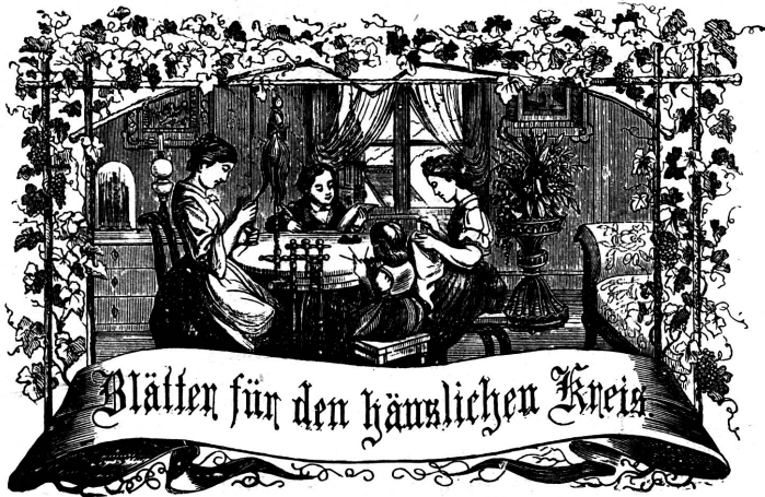
Motto: Immer strebe zum Ganzen, und kannst du selber kein Ganzes werden, als dienendes Glied schliesst an ein Ganzes dich an!

Redaktion und Verlag: Frau Elise Honegger, Wienerbergstraße Nr. 7.