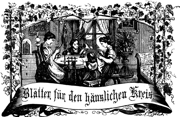
Motto: Immer strebe zum Ganzen, und laß dich von selber kein Ganzes werden, als dienendes Glied schliesst an ein Ganzes dich an!

Organ für die Interessen der Frauenwelt.