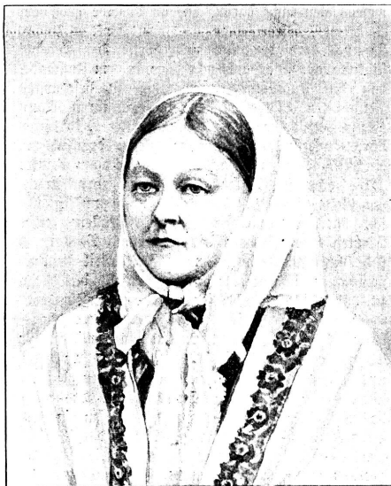
Miss Florence Nightingale.

Ehrendiplom persönlich zu überbringen. Ich wünschte dringend, die hochherzige Dame zu sehen, die in aller Bescheidenheit auf ein halbes Jahrhundert der angestrengtesten und segensreichsten Thätigkeit auf dem Gebiete der Krankenpflege und Krankheitsverhütung zurückblicken kann. Der Centralvorstand war so freundlich, die Anfertigung des Diploms zu beschleunigen und es mir nach London einzusenden. Es war sehr hübsch ausgefertigt, englisch abgefaßt und lautete in deutscher Uebersetzung: