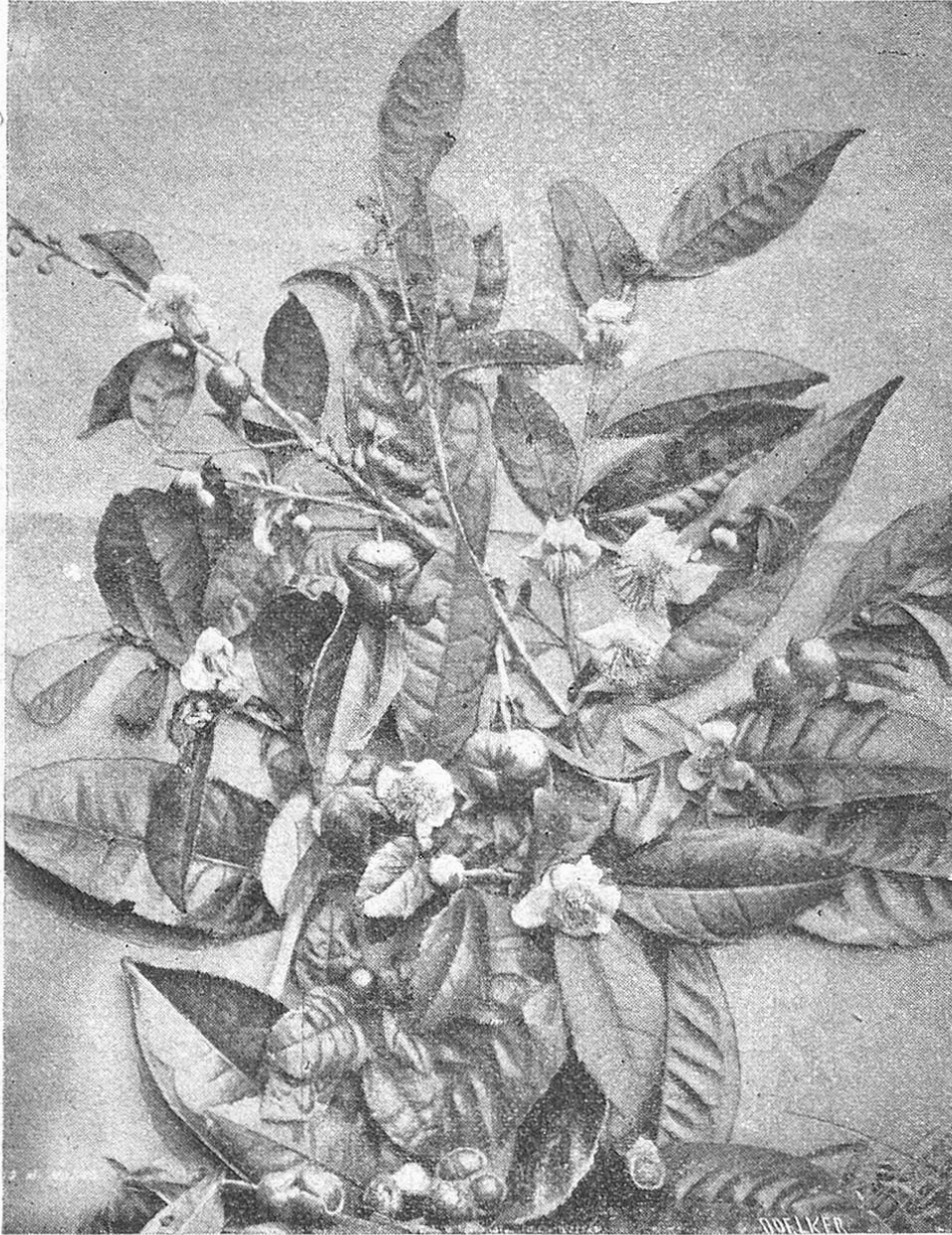
Blätter, Blüten und Früchte des Theebaumes.

Aufguß trage 2 man ohne die Blätter auf. Läßt man die Blätter länger, als drei Minuten ausziehen, so zieht man auch die in großer Menge 1 in den Blättern enthaltene Gerbsäure (Tannin) aus, welche dem