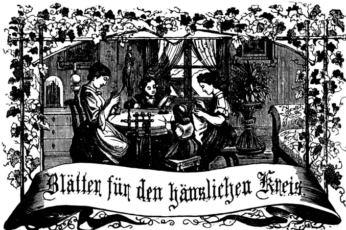
Motto: Immer strebe zum Ganzen, und kannst du selber kein Ganzes werden, als dienendes Glied schliesst an ein Ganzes dich an!

Frau Elise Honegger, Wienerbergstraße Nr. 7.