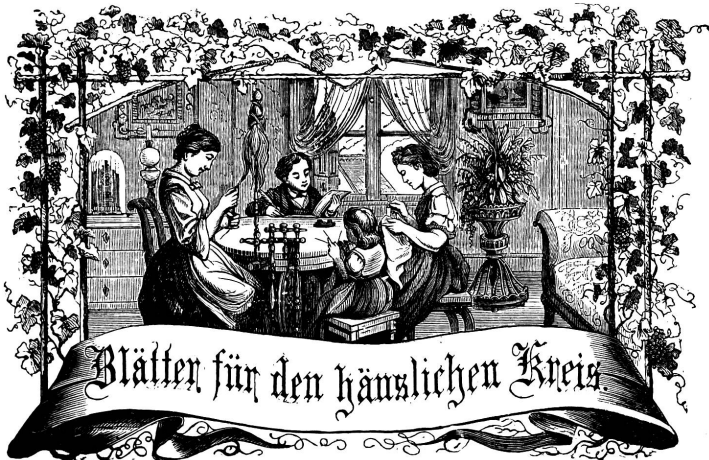
Motto: Immer strebe zum Ganzen, und kannst du selber kein Ganzes werden, als dienendes Glied schliesst an ein Ganzes dich an!

Organ für die Interessen der Frauenwelt.