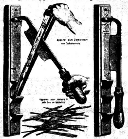
Der Apparat lässt sich überall leicht befestigen. Länge: 43 cm, Gewicht: 1/2 0.850. Preis Fr. 5.- franco durch die ganze Schweiz. Wo nicht in Einzelhandlungen erhältlich, direkt durch A. G. V. Glutz-Blotzheim Nachf. Solothurn

Eine Wohlthat für jede Haushaltung. Angesichts der fortwährend sich ereignenden Unglücksfälle, herbeigeführt durch das Anfeuern mit Petrol, sollte die Anschaffung dieses Apparates, welcher jeder Gefahr vorbeugt, Niemanden gereuen. Kolossal-Apparat, Patent 47 9346.