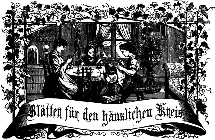
Motto: Immer strebe zum Ganzen, und kommst du selber kein Ganzes werden, als dienendes Glied schliesst an ein Ganzes dich an!

Abonnement. Bei Franco-Zustellung per Post: Jährlich . . . . . Fr. 6.— Halbjährlich . . . . . „ 3.— Ausland franco per Jahr „ 8. 30