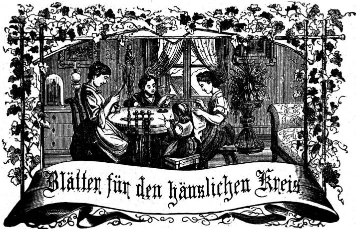
Motto: Immer strebe zum Ganzen, und kannst du selber kein Ganzes werden, als dienendes Glied schliesst an ein Ganzes dich an!

Organ für die Interessen der Frauenwelt.