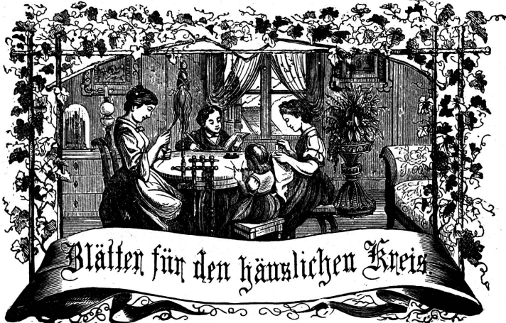
Motto: Immer strebe zum Ganzen, und damit du selber kein Ganzes werdest, als dienendes Glied schliesse an ein Ganzes dich an!

Organ für die Interessen der Frauenwelt.