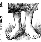
Nach der Behandlung.