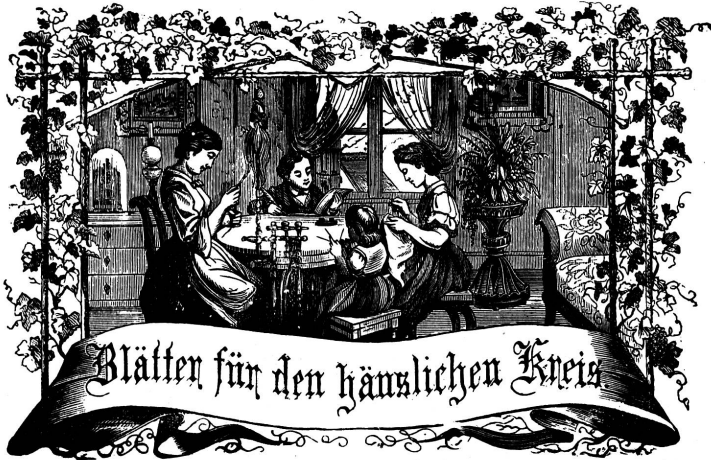
Wort: Immer Kreise zum Gange, und kannst du selber kein Gange werden, als dienendes Glied schliesst an ein Ganges dich an!

Organ für die Interessen der Frauenwelt.