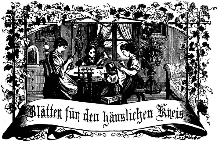
Motto: Immer freie zum Ganzen, und kannst du selber kein Ganzes werden, als dienendes Glied schliesst an ein Ganzes dich an!

Organ für die Interessen der Frauenwelt.