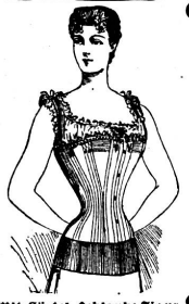
Mit Gürtel. Schlanke Figur!

Zu beziehen durch die Gummi-Wirkerei Hofman in Elgg (Kt. Zürich).