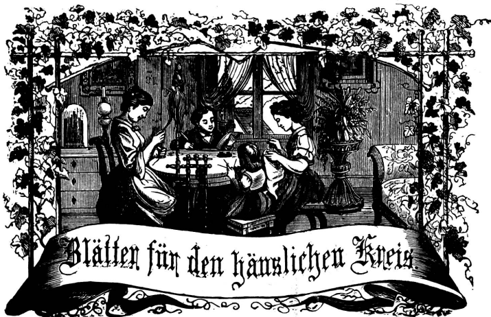
Witz: Immer freie zum Gange, und kannst du selber kein Gange werden, als dienendes Glied schließ an ein Gange dich an!

Organ für die Interessen der Frauenwelt.