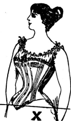
Ohne Gürtel. Starke Figur!

für Damen, die einen starken Leib und starke Hüften haben, macht eine elegante, schlanke Figur, kann leicht an jedem Corset befestigt werden, kein Annähnen notwendig, bequem, angenehmes Tragen, ist Frauen nach der Entbindung besonders zu empfehlen. Hüftenweite angeben.