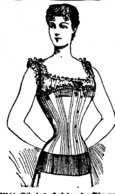
Mit Gürtel: Schlanke Figur!

Suppen-Würze Bouillon-Kapseln Suppen-Rollen