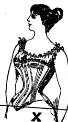
Ohne Gürtel: Starke Figur!