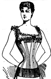
Mit Gürtel: Schlanke Figur!

Zu beziehen durch die Gummi-Wirkerei Hofman in Elgg (Kt. Zürich).