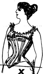
Ohne Gürtel: Starke Figur!