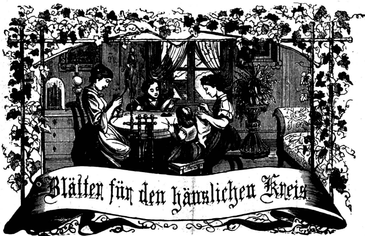
Motto: Immer strebe zum Ganzen, und kannst du selber kein Ganzes werden, als dienendes Glied schließ an ein Ganzes dich an!

Organ für die Interessen der Frauenwelt.