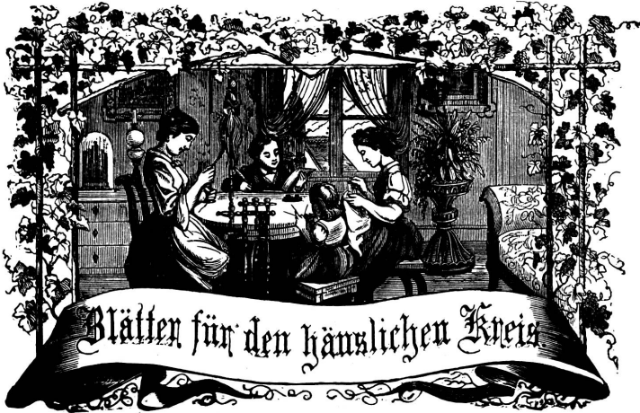
Motto: Immer freie zum Ganges, und dannst du selber kein Ganges werden, als dienendes Glied schlich an ein Ganges dich an!

Organ für die Interessen der Frauenwelt.