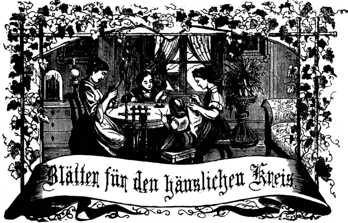
Motto: Immer strebe zum Gange, und kommst du selber kein Ganges werden, als dienendes Glied schliesst an ein Ganges dich an!

Organ für die Interessen der Frauenwelt.