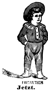
I WEAR THEM Jetzt.