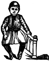
ICH HABE Einst.

Schwache Knöchel bleiben gerade und krumme werden gerade in F. Beurers