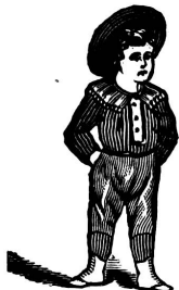
I WEAR THEM Jetzt.