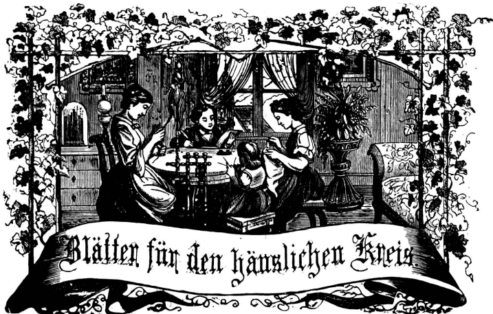
Notiz: Immer strebe zum Ganzen, und kommst du selber kein Ganzes werden, als dienendes Glied schliesse an ein Ganzes dich an!

Organ für die Interessen der Frauenwelt.