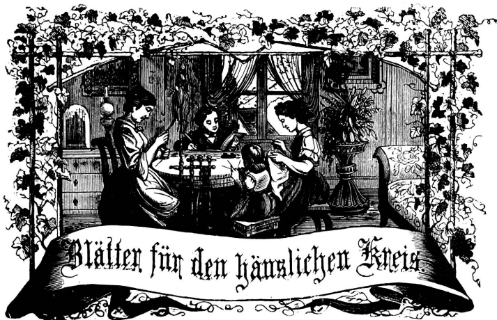
Rechts: Immer strebe zum Ganzen, und kannst du selber kein Ganzes werden, als kleinstes Glied schliesst an ein Ganzes dich an!

Organ für die Interessen der Frauenwelt.