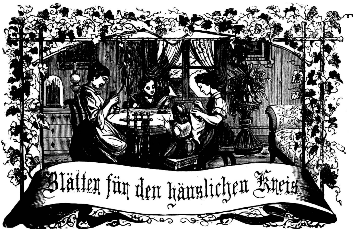
Wohls: Immer strebe zum Gange, und kannst du selber kein Gange werden, als dienendes Glied schliesse an ein Gange dich an!

Organ für die Interessen der Frauenwelt.