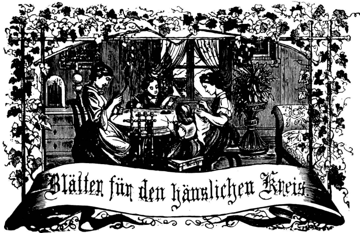
Worte: Immer treibe zum Ganzen, und kannst du selber kein Ganzes werden, als kleinstes Glied schließ an ein Ganzes dich an!

Organ für die Interessen der Frauenwelt.