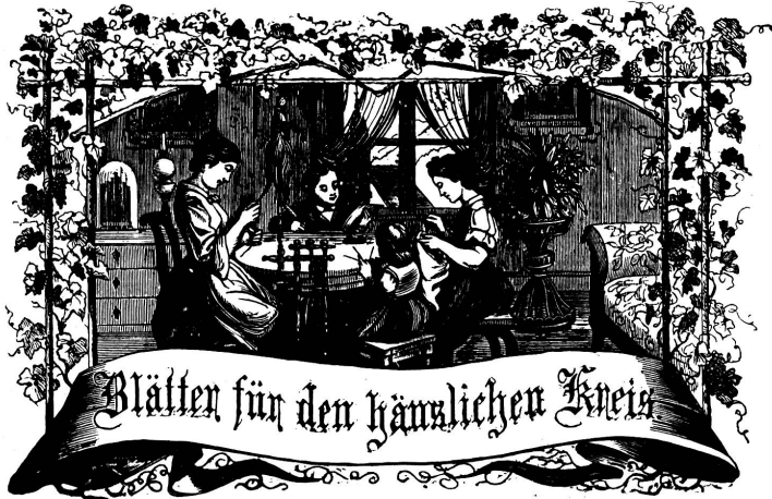
Motto: Immer strebe zum Gange, und kannst du selber kein Ganges werden, als dienendes Glied schlies an ein Ganges dich an!

Organ für die Interessen der Frauenwelt.