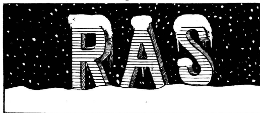
von Sutter-Krauss & Cie., Oberhofen.

Für besseres Schuhwerk verwende man bei Schnee Hochglanzfett