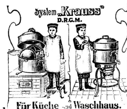
Für Küche und Waschhaus.

über 65,000 im Gebrauch. Die vollendetste aller Waschmaschinen mit Unterfeuerung. Sie wäscht, kocht, dämpft, desinfiziert und spült die Wäsche zu gleicher Zeit bei 75% Kraft- u. Materialersparnis. Verlangen Sie Katalog und Zeugnisse von [1021 A. Saurwein, Weinfelden mechan. Werkstätte und Velofabrik.