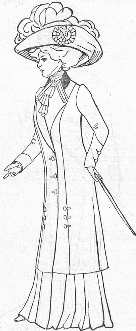
1. Langes Mantelkostüm.

Der natürlichen Entwicklung der Jahreszeiten folgend, widmet die vorzorgende Mode stets zuallererst ihr Interesse der Konfektion, dem neuen Winterkostüm nebst den für die kalten Tage notwendigen Umhüllen. Das Schicksal der herrschenden Paletotform hat sich schon in der Herbstsaison entschieden, es sind durchaus keine umstürzlerischen Ideen, die uns Frau Mode zur Annahme darbietet, der lange Paletot, dessen Schnittform noch die des sommerlichen Leinenkostüms erkennen läßt, wird ins Unendliche variiert werden. Da ist vor allem noch der gleiche breite Rücken- teil, der sich nur leicht der Gestalt anschmiegt; allerdings hat er — für den Kenner — seine Schnittform etwas geändert, indem sich seine Seitennähte nicht mehr so liniengerade dem Seitenteil ansüßen, sondern jetzt in leichter Schweifung nach der Schulternaht ins Armloch laufen. Auch die Seitenschweifung hat mehr die Tendenz, der Taillenlinie zu folgen, so daß die meisten Paletots eine nahezu anliegende Form zeigen. Es ist dies eine Konzession von praktischem Wert, der lange gefütterte Mantel aus schwerem Wintergewebe würde belästigend auf die Schultern drücken, wenn nicht die Hüften mittragen helfen. Denn der Winter-