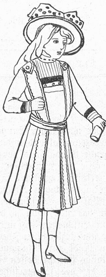
3. Einfaches Kleid.

lassen, um überhaupt schreiten zu können und seitliche Schlitze als ein Verstoß gegen die Mode gelten würden, so schneidet man die Seitenteile wieder weiter, ja es macht sich sogar schon eine Vorliebe für leichte Tütenfalten geltend. Wir dürfen also wohl zufrieden sein mit der vernünftigen Moderichtung, dabei sind die neuen Mäntel von einem so gefälligen Schick, wie seit lange nicht.