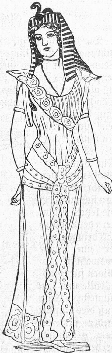
Fig. 3. Maskenkostüm: Ägypterin.

pieren und zwar mit Hilfe eines jetzt hochmodernen Ballstoffes. Der wundervolle Seidenboile mit seinen eingewebten Schleifenfiguren, die Silberperlen und =Flittern beleben, paßt sich gleich gut dem Empirestil wie der Moderne an. Denn mit modernen Geweben müssen wir ja heute selbst beim echten Kostüm rechnen. Alter Stoff, wenn er auch in kleinen vielbewunderten Resten uns überkommen ist, verträgt nicht mehr die Strapazen einer Ballnacht.