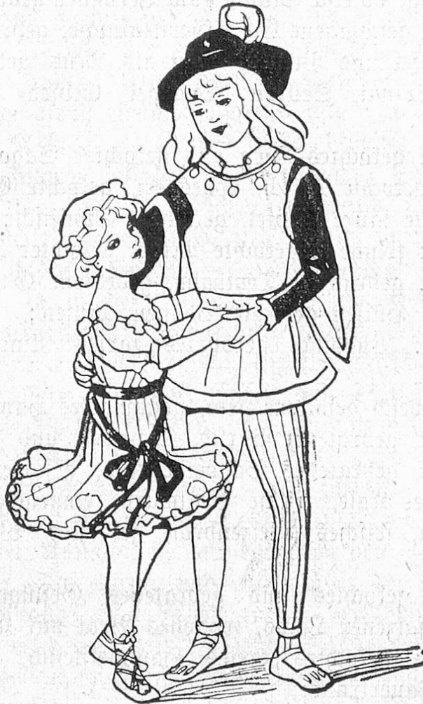
Fig. 4. Maskenkostüm: Balletteusef. kl. Mädchen

Ueberkleider aus dunklem Chiffon oder Tüll. Neue Farben sind: „tête de nègre“, ein bräunliches Dunkelgrau, „aile de corbeau“, ein schwärzliches Blau, „hirondelle“ ein bläuliches, sehr dunkles Violett, „sapin“, ein dunkles Grün.