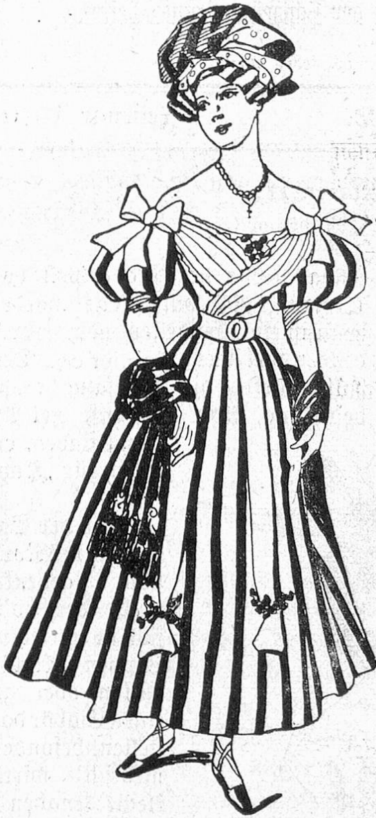
Fig. 2. Biedermeierkostüm aus ge- streiftem Stoff.

Wer darauf keinen Wert legen will oder kann, der wähle ein Phantasie- Kostüm, statt es mit allem Raffinement des modernen Geschmacks aus und suche die vorteilhafteste Form für Kleidsamkeit zu finden. Das Kostüm, Abb. 2, ist z. B. genau einem Modenkupfer jener Zeit nach- gebildet. Auch Empirekostüme lassen sich leicht in tadelloser Echtheit ko-