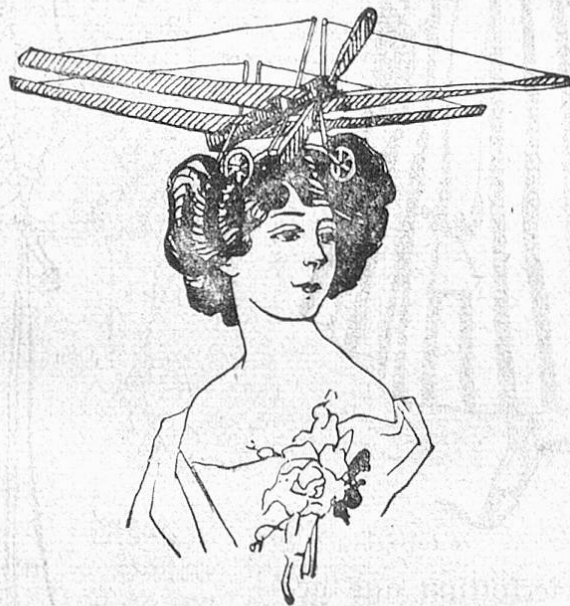
Fig. 1. Maskenkopfsputz: Aeroplan für tête-parée-Feste.

kenpanorama der Modenwelt vom 1. Jan. 1907 dargestellt worden, heute ist ein „Eindecker“ oder „Zweidecker“ viel mehr d'ernier cri. Deshalb dürfte die kleidsame Kopfbedeckung, Abb. 1, gewiß viel Anklang finden, vor allem für „Kopffeste“.