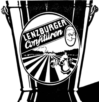
Der 5 Kilo Eimer