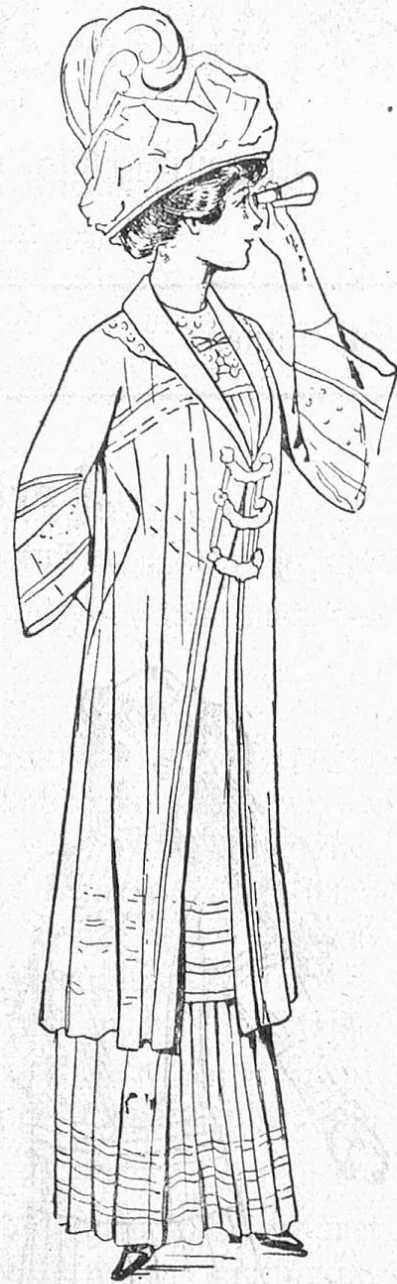
Fig. 3. Schleiermantel aus te Aufschläge, Boile-Ninon für Rennen usw.

wahrten so erleichtert wie gerade jetzt, und dies dürfte mancher praktischen Frau als eine recht angenehme Mode-laune erscheinen. Die Tail-leurs sind kompliziert und phantasiereich kombiniert. Die Röcke u. Jacken zeigen die übereinstimmenden Arrangements: Banneaux, übereinandergeklappte oder geknöpf-