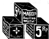
Bouillon - Würfel