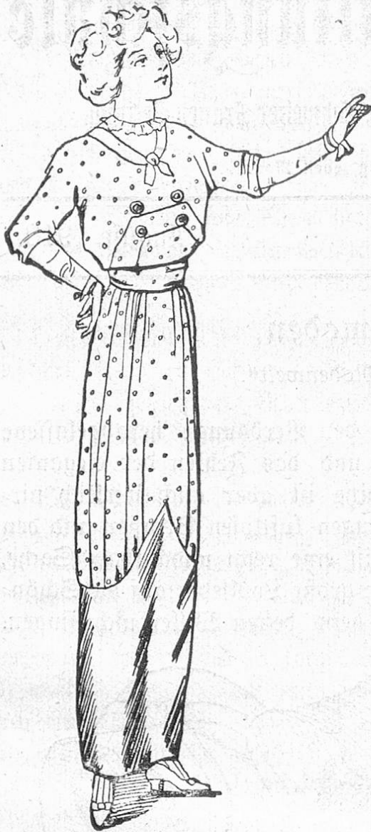
Fig. 3. Eine Toilette vom modernsten Schick.

lassen Revers und Manschetten das abstechend farbige Futter sehen, das Eleganteste sind jedoch die Kostüme aus rabenflügelblauem großgewässerten Moirée im schlichsten Schnitt, ohne irgendwelche Steppnähte, mit großen Knöpfen aus dem gleichen Stoff. Von dem Schick einer solchen Toilette kann man sich schwer einen Begriff machen, wenn sich ihr noch ein großer schwarzer Hochhaarhut mit glockenförmiger Krempe gesellt, dessen