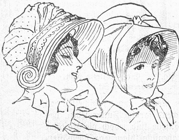
Fig. 1 und 2. Autohüte, die die kommende Hutform haben.

Die ausschweifendste Phantasie eines Humoristen könnte keine eigenartigere Silhouette malen als die der streng modern in ein Tailor made gekleideten Frau, wenn sie sich mit trippelnden Schritten durch