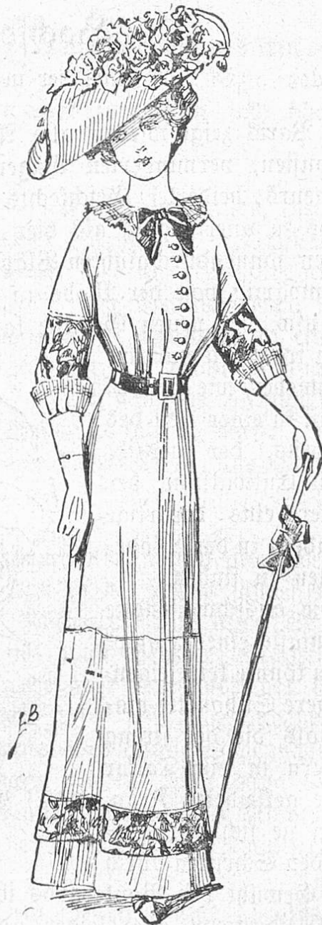
Fig. 4. Hochsommerkleid mit Kimonotaille.

Die hervorstechendste Modeneuheit sind die buntfarbig seidenen Tailleurs: kurz enge Röcke mit einem nur gerade die Hüften deckenden Paletot im Phantasieschnitt. Häufig