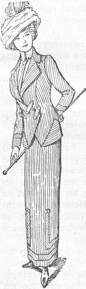
Fig. 1. Jackenkostüm mit wechselnder Streifenlage aus blauweiß gestreifter Seide. Tüllhut in Turbanform.

Paris. — Mit den ersten Frühjahrstagen kommen die Morgenpromenaden im „Bois“ wieder an die Tagesordnung, da sieht man die ersten Tailleurs der demi-saison, die kleinen einfachen Kostüme, die den Damen eine so unvergleichliche Allüre, einen so jugendlichen Schick verleihen. Die schon im Herbst in den Vordergrund getretenen Ratinés, finden als Uebergangstailleurs erst recht ihre Verwendung; die meist abstechend farbige Rückseite gibt Anlaß zu sehr hübschen Zusammenstellungen; die Außenseite ist gewöhnlich dunkel, die Innenseite heller gewebt; diese Rehrseite liefert dann das Material zu den Aufschlägen, Blenden oder Seitenbahnen. Ein ganz reizendes Kostüm war aus schildplattfarbigem Ratiné, die innere Seite hell nußfarbig. Ueber den glatten hellen Rock fiel eine kurze, zu beiden Seiten tiefe Zacken bildende dunkle Tunika, der kurze dunkle Paletot zeigte einen matrosenartigen Kragen, mit sehr großen weichfallenden Aufschlägen aus nußfarbigem Ratiné und ebensolche umgestülpte Aufschläge an den Armen. In der Zusammenstimmung der Töne lag der besondere Reiz des Kostüms. Hübsch wirken Ratinés in zwei Nuancen von Blau, Grau, Violett; Ziegelrot und Hellrot ist etwas zu grell. Weiß und schwarz gemischte englische Stoffe, Grisaille, grau ineinander verschwommen sind beliebt, manchmal sind diese mit fast undefinierbaren Farbentupfen durchsprinkelt, wie Hellrot, saftig Grün, Mandarinengelb. Glatte