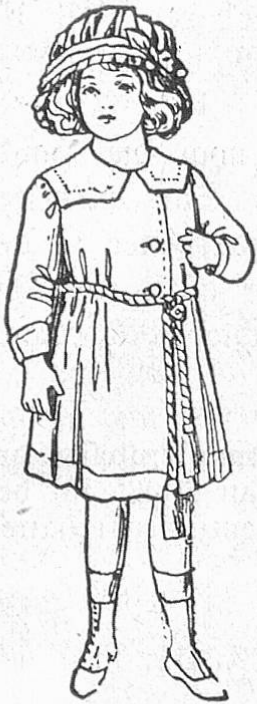
Fig. 3. Mäntelchen mit abgebundener kurzer Taille für Kinder von 3—6 Jahren. Aus Leinen oder Rohseide.

sche weiße Atlaskleid durch allerlei moderne Gewebe mehr und mehr verdrängt wird.