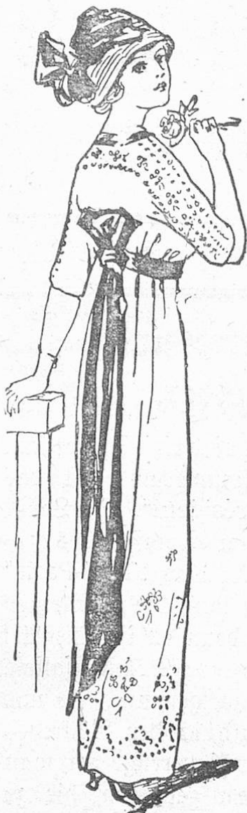
Fig. 2. Abgepaßtes Stickereikleid (Kartonrobe) mit breitem Schärpenarrangement.

reichen Taffet, den die Mode wieder begünstigt, unterbrachen sehr wohltuend das Bild, und bewiesen von neuem die große Bevorzugung des schwarzen Anzuges. Es ist unglaublich, wie viel Fransengarnituren in Verwendung kommen, bald aus Seide, Chenille, Perlen oder Wolle, in allen Breiten und Ausführungen. Sehr bewundert wurden einzelne prächtig und vornehm wirkende Toiletten aus alten Spitzen; Venezianer Gipiüre, Point de Gène, Point de Milan und andere Kostbarkeiten werden in höchst geschmackvoller Weise mit Seidenfaschmir, Marquisette oder Seiden-