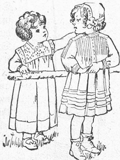
Zwei erste Kleidchen für Babies.

Die weißen Toiletten waren an dem sonnig-heißen Sonntag in Longchamps wieder besonders stark vertreten, und zwar aus Foulard, Seide, Serge, Cheviot und vor allem aus Velvet! Diese Velvettailleurs sind nicht nur das Eleganteste, sondern auch das Schönste. Sie sind reinweiß oder elfenbeinfarbig, oder von weit auseinandergerückten schwarzen oder dunkelblauen feinen Streifchen durchzogen — mit farbigem Umlegekragen als belebende Note. — Diese weißen, glatten oder gestreiften Velvettokostüme werden im Hochsommer am Strand und in den Modebädern an kühlen Tagen das weiße Wollkleid ersetzen. Auch viele schwarze Taffettailleurs, aus jenem wundervollen