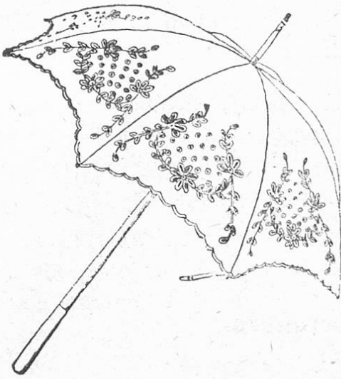
Fig. 5. Achteiliger Sonnenschirm mit Lochstickerei. Gestochene Schablone liefert das „Musterzeichenatelier d. Modenwelt“, Berlin W, Lüchowstraße 84, für 60 Fig. (75 h.). Größe: 53 cm, m. Stock 107 cm.

Tailleurs beschränkt sich dieselbe auf Matrosenträger oder Umschlagtragen, sowie Manchetten; über die Seiten- oder Stoffaufschläge fallen oft gestickte Doppelrevers, die aus Linon oder feinem Leinen hergestellt, reich von Hohlsäumen, Richelieu-, Colbert- oder Blattstickerei durchbrochen, wahre Meisterwerke der Nadel sind. Fig. 1 bringt ein Kostüm mit kurzem Säckchen, das der „Modenwelt“ (Verlag Bruckmann, Berlin W, Lüchowstr. 84) entnommen ist. Für die Nachmittagskleider mischt man die vergilbten nach alten Mustern ausgeführten Stickereien, mit allen denkbaren Seidenstoffen, mit durchsichtigen, hellen, wie dunklen Geweben. Die durchsichtigen, anschmiegenden Stoffe sind noch stark an der Tagesordnung, was bei der lustigen Unterkleidung, die die Mode vorschreibt, oft derartig plastische Wirkungen erzeugt, daß sie gelinde ausgedrückt, „ungewohnt“ genannt werden müssen! — Und man behauptet in den wohlunterrichteten Modekreisen, daß der Sommer mit seinen Linons, Boiles und Mouffelinstoffen uns noch größere Ueberraschungen in dieser Hinsicht bringen wird! —