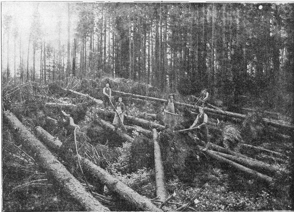
Waldschaden. — Aufgenommen in einem Walde im Hargau.