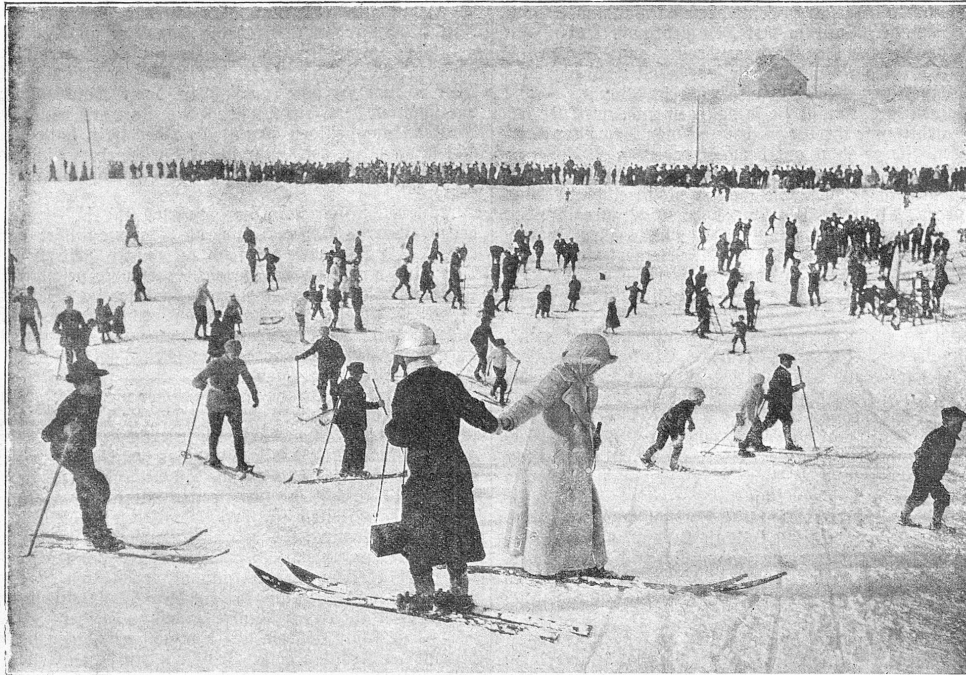
Winterportleben in Andermatt.