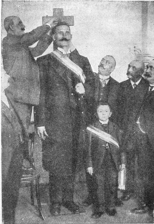
Der größte und der kleinste deutsche Reichstagswähler.