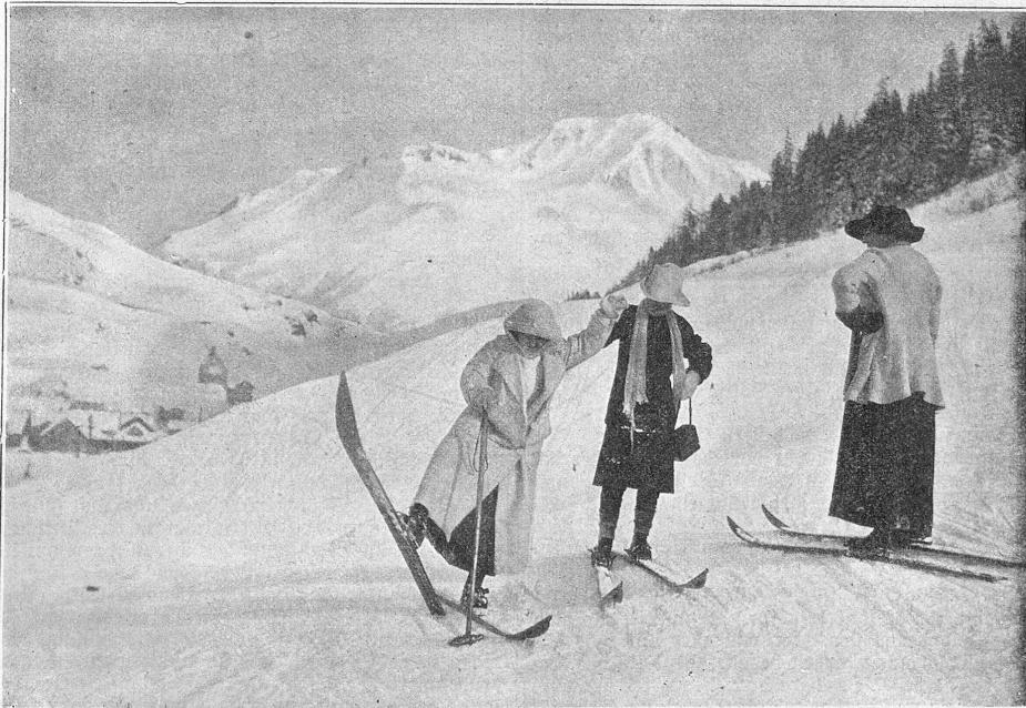
Zum Wintersportfest in Andermatt: Aller Anfang ist schwer.