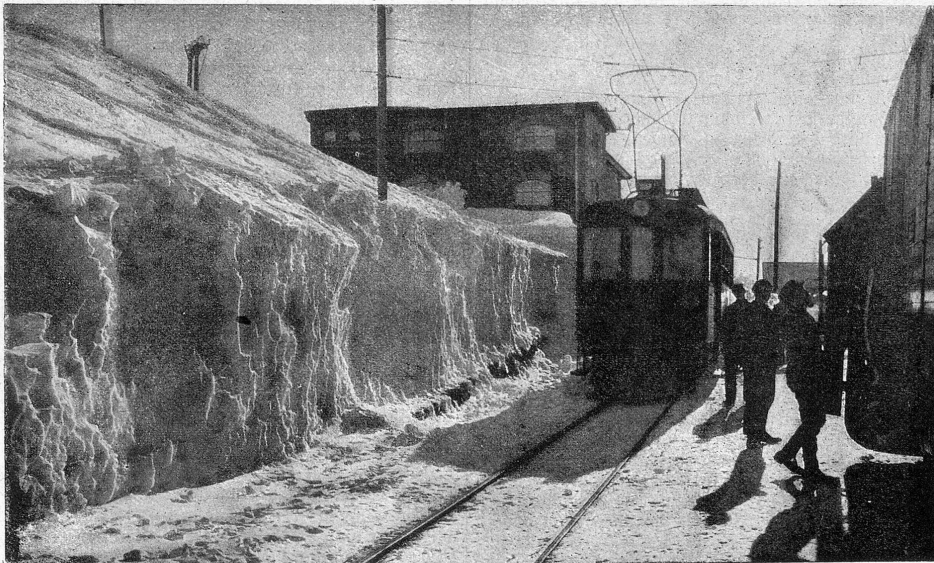
Bernina Hospiz in Schnee.

Das Bild in der Mitte zeigt südliche Begeisterung. Aus dem Kriege zurückkehrende Ambulanzen werden in Mailand von einer riesigen Volksmenge stürmisch begrüßt. Das südliche Blut reizt die Menge zu Ueberschwenglichkeiten hin, wie sie eben blos dem Südländer eigen sind. — Unten finden wir böhrende Knaben auf Schlitten und hier rechts präsentieren sich zwei Winterbilder aus Graubünden: Der aufstrebende Kurort Arosa und das Bernina-Hospiz.