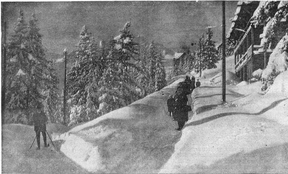
Arosa im Winter (1 Meter Neuschnee).

Auf der Titelseite fällt dem Leser das ergreifende Bild: Abschied von der Mutter ins Auge. Der junge Krieger schließt seine alte Mutter zum letzten Male in seine Arme. Er muß in's Feld rücken, ob er die Mutter wieder sehen wird, das ist fraglich. — Auf der nebenstehenden Seite zu oberst finden wir die Abbildung des neuen Gebäudes der schweizerischen Nationalbank in Bern, in Roccocostyl gehalten. Die Säulenkolonne in der Front gibt dem hübschen Gebäude einen monumentalen Anstrich. Die Nationalbank ist mit den neuesten technischen Einrichtungen der Neuzeit versehen. Im ersten Stock befinden sich die Bureaux der Zweiganstalt Bern und der Sitzungssaal des Bankauschusses, im zweiten ist die Generaldirektion zu Hause; ferner das Bankpräsidium und der Subdirektor. Das dritte Stockwerk ist bis auf weiteres von der eidgenössischen Verwaltung für