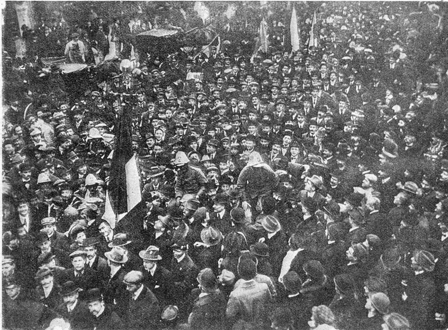
Aus dem Kriege zurückkehrende Ambulanzen, von den Mailändern begrüßt.