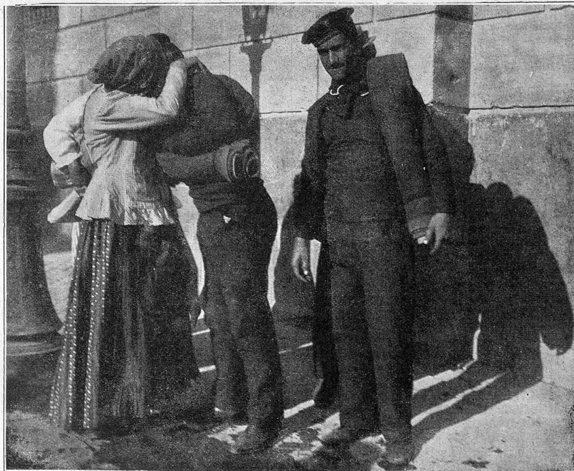
Abschied von der Mutter.