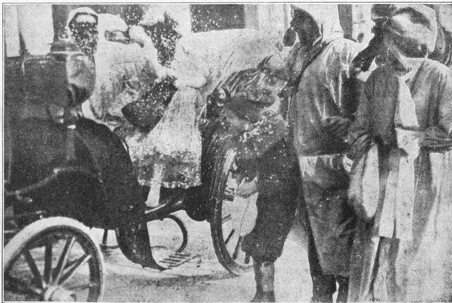
Karneval in Nizza. — Die Konfettischlacht.

Lehmich wie im Süden das lebenslustige Volk an der Riviera, feiert man im deutschen Norden drunten am Rhein in und um Köln den Karneval.