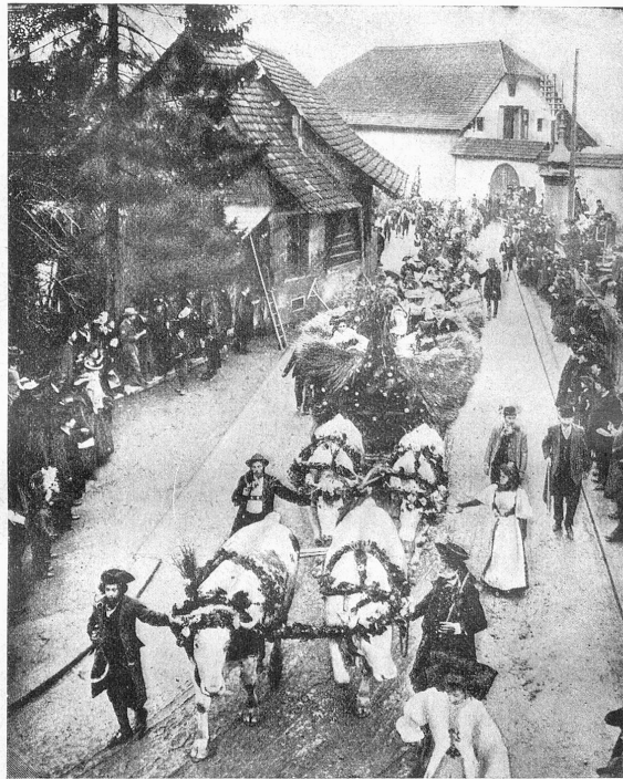
Karneval in Luzern: Der Erntewagen. (Frittschi-Umzug.)