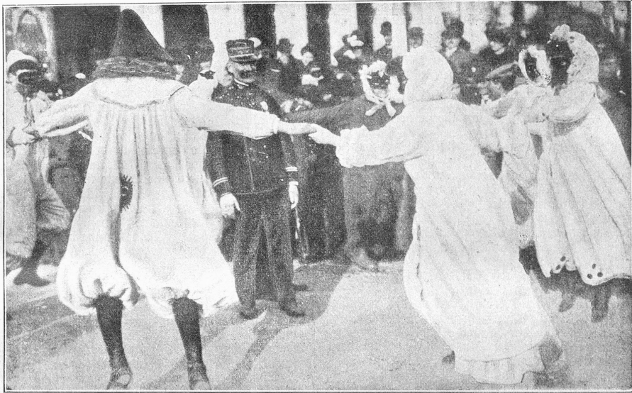
Karneval in Nizza. — Ein beliebter Fastnachtscherz.

Vom Karneval in Nizza bringen unsere zwei Bilder dieser Seite zwei überaus lustige Szenen. Wird der Faiching im Süden ohnehin viel mehr gefeiert, so sind es vorab die Bewohner der Riviera, welchen der Karneval sozusagen im Blute steckt. Hier findet man auf die Fastnacht die überschäumende Lebenslust, die man bei uns — wenige Ausnahmen ausgenommen — vermisst. Oder ist das obere Bild, wo die übermütigen Masken einen Gendarmen umringen und „kampfunfähig“ machen, nicht zum Lachen? Das südliche Blut, das der Freude in höchster Potenz huldigt, feiert zur Zeit des Karnevals seine Triumphe. Unten erblicken wir