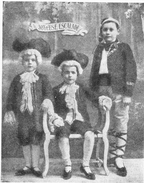
Karneval in Genf (Escalade): Eine hübsche Kindergruppe mit Trachten aus dem Mittelalter. Oben die Inschrift: Fröhliche Escalade. — Das anziehende Bildchen bezieht sich, wie unten ausgeführt wird, auf die alljährlich gefeierte Genfer Escalade.