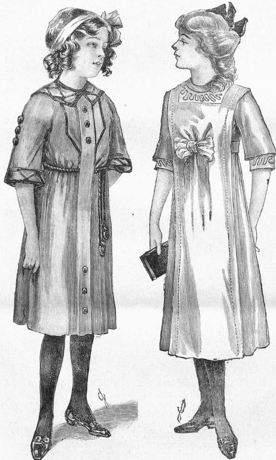
3613. Kleid aus rotem Wollstoff mit schwarzen Börtchen und Knöpfen.

Schnitt in Mädchengröße 11, 13 und 15, sämtliche bei Ullstein & Cie., Berlin S. W. 68, Schnittmüller-Abteilung, gegen 60 Cts. in Briefmarken.