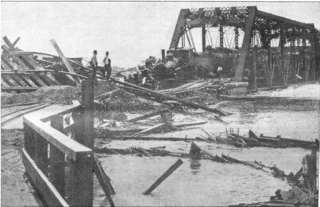
Zur Hochwasser-Katastrophe des Mississippi: Die zerstörte Eisenbahnbrücke bei der Stadt Memphis. Ueber zwölf Städte wurden teilweise zerstört und 257 000 Einwohner obdachlos.