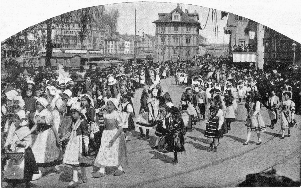
Vom Zürcher Sechseläuten am 22. April: Hauptansicht des Festzuges.

No mängisch suechsch de ds andre-n-Ufer, Und luegch voll Heimweh wieder zrüef, Und chansch dr Wäg halt nie meh finde, I d'Schuelzyt und i ds Jugedglück. E. Wüerich.