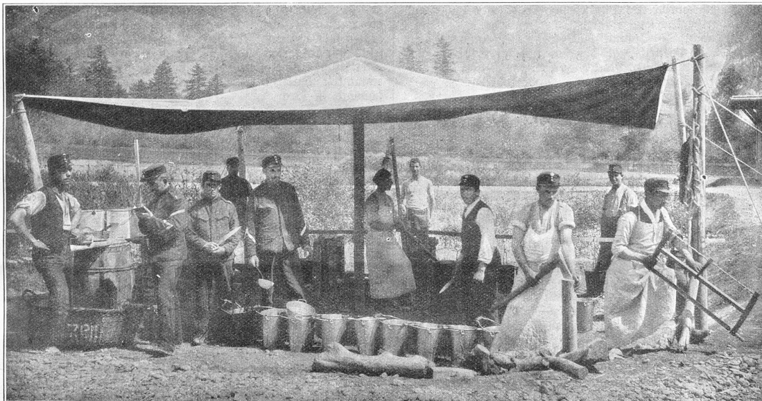
Ein Teil unserer neuen Gebirgsregimenter beim Abkochen.

die braunen, kleinen Hütten und die weißen Häuser lagen taghell beleuchtet da. Man konnte auf einigen die dicken Balen Hauswurz erkennen, die wie schwarze Tiere auf dem Dachfirst lagerten. Das Gächchen vom See blinkte plötzlich silbern auf, eine würzige Luft mit einem Duftgemisch von Tannen und leichtem Moder drang zum geöffneten Fenster in die trauliche Stube.