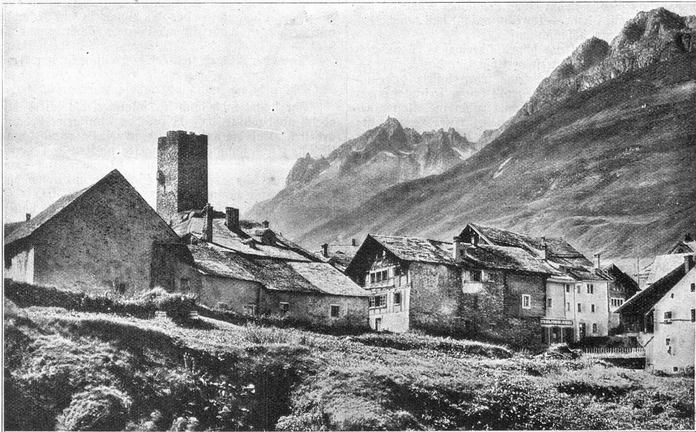
Hospental mit Mutterlischorn. Ausgangspunkt der Gotthardstraße. Mitten im Dorfe der alte Lombardenturm.

Die Julizeit — die Serienzzeit: Das Gegenstück vom Winter! Wie freuen sich da weit und breit Die Großen und die Kinder! Nun gibt's für Wochen süße Raft Und Freude ungebunden! Sort mit der dumpfen Alltagslast! Und Kränze bunt gewunden!