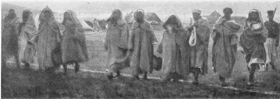
Die Unruhen in Marokko: Eingeborene, die für den Heiligen Krieg agitierten, werden dem Kriegsgericht vorgeführt. Marokko, das von den Franzosen eroberte Land, wird durch Fanatiker aufgewühlt, die den Heiligen Krieg gegen die Ungläubigen und den von ihnen beeinflussten Sultan predigen. Sobald die französischen Militärbehörden solche Aufwiegler erwischen, wird mit ihnen kurzer Prozeß gemacht. Sie werden vor ein Kriegsgericht gestellt, summarisch abgeurteilt und sofort hingerichtet.

Der Doktor! Das ist's gerade, was mich so in Harnisch gebracht hat. Einmal hatten sie ihn allerdings geholt, aber erst als es schon sehr spät war. Wie er dann darüber wet-