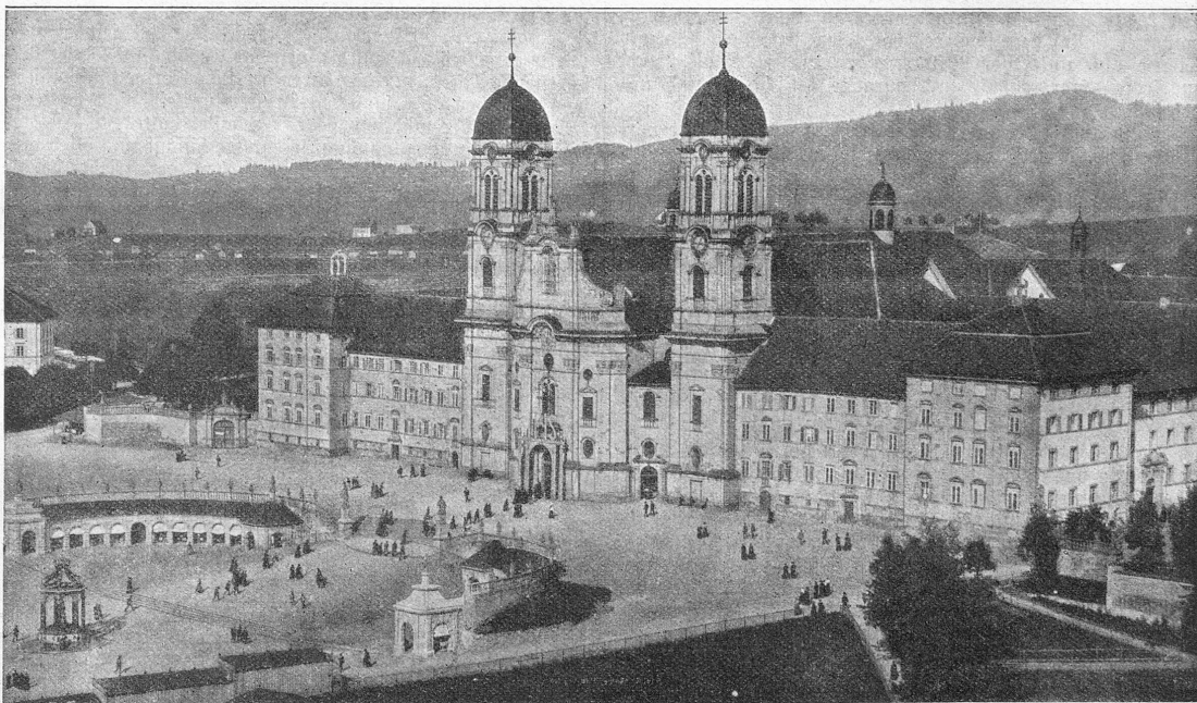
Das Kloster Einsiedeln.

Die große Stadt hatte etwas Erwartungsvolles, Festliches. Es war ein klarer, kalter Winterabend mit leuchtenden Sternen und Vollmond. Dazu die glänzend erhellten Läden, in deren Schaufenstern verführerisch Luxus-, Toi- lette- oder Bekleidungs- gegenstände ausgefellt waren. Ringsum ein wun- derbares Chaos von Farben und Tönen, die entzücken, nimmt sie ein Kenner wahr. Man rüstete sich zur Weihnacht! Manche Augen ahnten etwas besonderes warmes im Blick. Dort trat ein schmieriger Bettel- junge von einem Fuß auf den andern, schlug die blauen Fäuste um den Leib und konnte