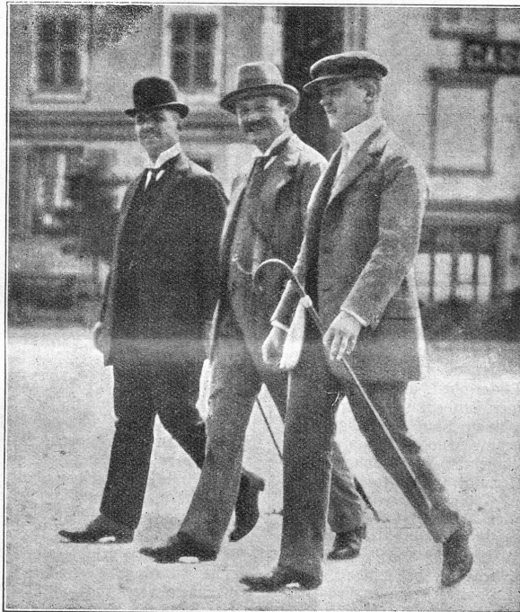
Der König von Sachsen (X) mit seinen zwei Söhnen, auf Besuch in Einsiedeln, wo er im Kloster (siehe Bild unten) die Beichte absolvierte.

Fahlgrau brach langsam der späte Wintermorgen an. Nebelige Dämmerung breitete sich über das schneeige Weiß da drau- ßen. Von der Kastenuhr des Wohnzimmers herauf töntes tief und klangvoll fünf Schläge, dumpf folgte die große Turmuhr; un- mittelbar darauf begann das Morgengebetleuten. Erschrocken fuhr Hilarius, der tief in seinen Erinner- ungen versunken gewesen war, zusammen. Zischend und qualmend verlosch eben der kleine Kerzen- stummel. Um nur etwas sehen zu können, mußte man sich erst an die nur durch hellen Schnee ver- frühte, ganz schwache Dämmerung gewöhnen. Leise schlich der junge Priester zum Bett, beugte sich laufschend über die junge Schläferin, nahm sie dann fest und behutsam in seine Arme und trug sie den langen Gang hinunter in ihre Kammer. Sorglich, liebepoll, wie ein Vater sein Kind, bettete er sie, die leise etwas im Schlaf murmelte und zu erwachen drohte, in ihre Kissen. Sein Kopf senkte sich auf die Brust; er atmete schwer und betrachtete