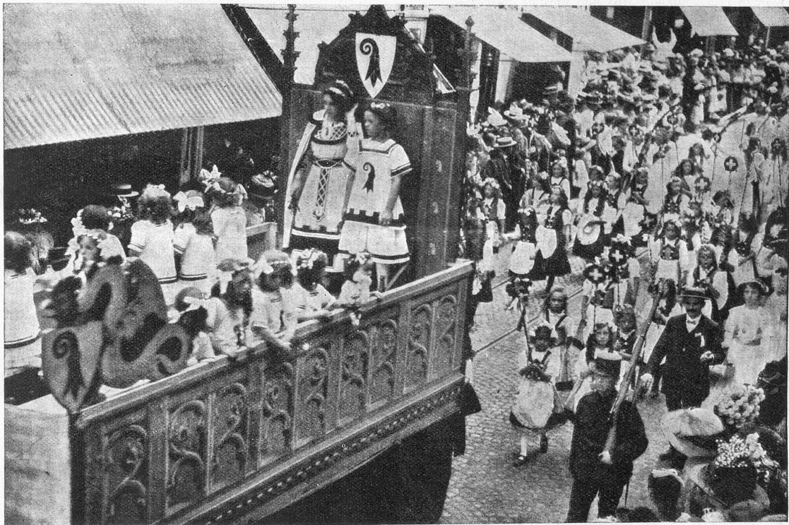
Zum Kinderfestumzug in Baselftadt. Basel begleitet von den Kindern der Helvetia.