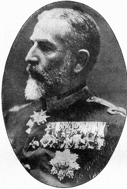
König Carol von Rumänien.