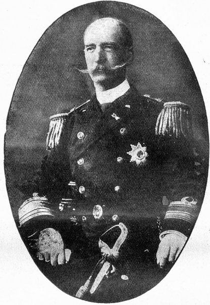
König Georg von Griechenland.

und Büchern eine Wasserflasche stand, einige Stühle und einen eisernen Geldschrank. An den Wänden hingen Landkarten und Fahrpläne, und der Fußboden war mit Tintenflecken übersät. Es war dasselbe Zimmer, in dem man damals, am Morgen nach der Mordnacht, die Leiche des alten Wucherers gefunden hatte. Habakuk Streicher machte die Besucher, die er ehren wollte, heute noch auf die Blutflecken in den Dielen des Fußbodens aufmerksam; freilich wurden sie nur von Leuten gesehen, welche nicht zugeben wollten, daß sie schwache Augen besaßen.