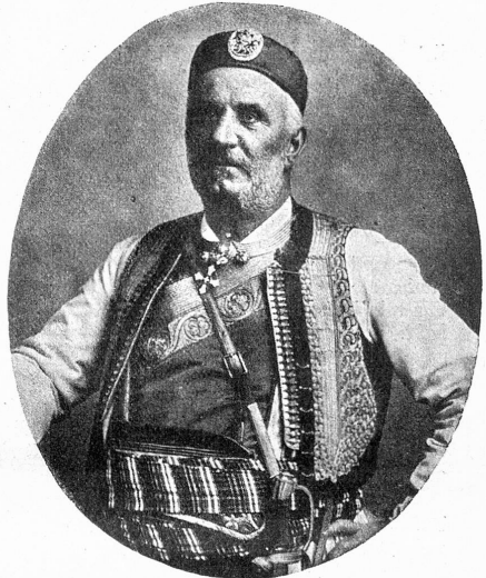
König Nikita von Montenegro.

„Vergleichen Sie diese Handschriften,“ sagte er, nun einen befehlenden Ton anschlagend; „finden Sie nicht auch, daß dieselben einander so ähnlich sind, wie ein Wassertropfen dem andern?“ — Der Blick des Schreibers