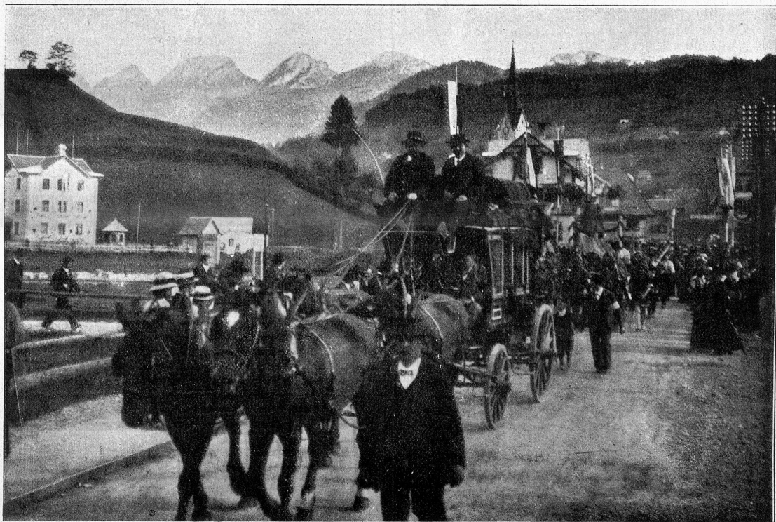
Der letzte Postwagen. Im Festzuge anlässlich der Eröffnung der neuen Bahnlinie Ebnat-Neflau ward auch der eidg. Postwagen mitgeführt, der bisher im oberen Toggenburg verkehrte.

Chumm i hüt no i mys Dörfli, Jede Stude, jede Baum Rennt mi no us junge Tage — Ihne möcht i öppis chlage, Deppis us mym Jugejd-Traum. J. L e r c h.