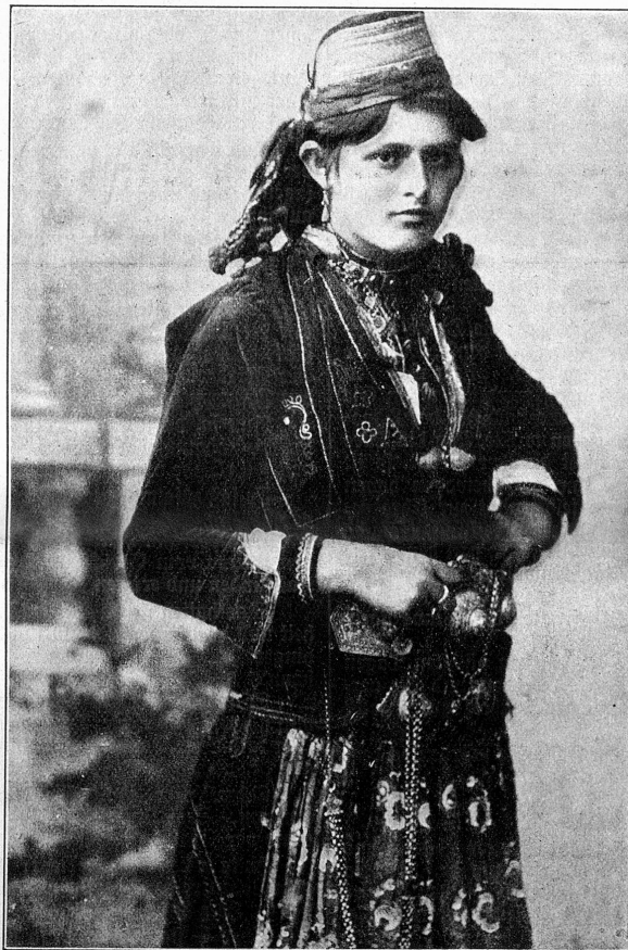
Eine albanesische Schönheit aus dem Sandschat Novi Bazar.

„Und eben deshalb warf ich ihn zur Türe hinaus,“