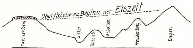
Abb. 2. Profil Tannenberg-Eggen, stark überhöht.

Die Hebung der Gesteinsmassen über den Meerespiegel bedeutet den Beginn der Geschichte unserer Landschaft. Heute ist der Freudenberg nahezu 900 m hoch; die abgebrochene Nagelfluhrippe, die feinen Grat bildet, zeigt aber im Querschnitt noch hoch in den Luftraum hinauf. Wir gehen kaum fehl, wenn wir die gefamte Hebung der Gegend auf einige tausend Meter beziffern. Das will nicht heißen, daß der Freudenberg einst ein Dreitausender war; vielmehr wurde wohl die Oberfläche in dem Maße, wie sie sich langsam hob, von den abtragenden Kräften unablässig angegriffen. Wenn mit einem Abtrag von nur einigen hundert Metern gerechnet wird, so folgt schon, daß es ein ausichtsloses Beginnen wäre, in den heutigen Formen der Landschaft noch Reste der ursprünglichen Oberfläche suchen zu wollen.