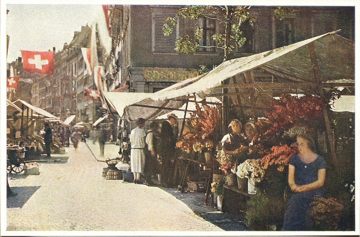
Blumenmarkt und 1. August an der Markt- und Neugasse