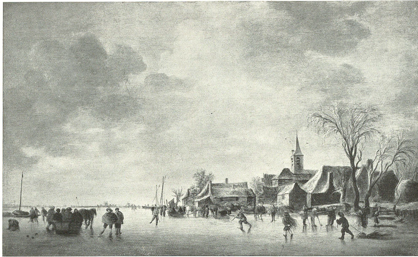
WINTER AN DER HOLLANDISCHEN KÜSTE Originalreproduktion nach einem Gemälde von Jan van Goyen (In ft. gallischem Privatbesitz)