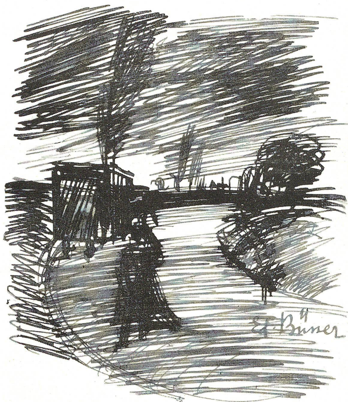
Sturm auf der Landstrasse.

Der Winter nimmt seinen Anfang, wenn die Sonne in das Zeichen des Steinbocks tritt, um Mittag den grössten Abstand vom Scheitelpunkt hat und so den kürzesten Tag hervorbringt, d. i. am 22. Dez., 3 Uhr 4 Min.