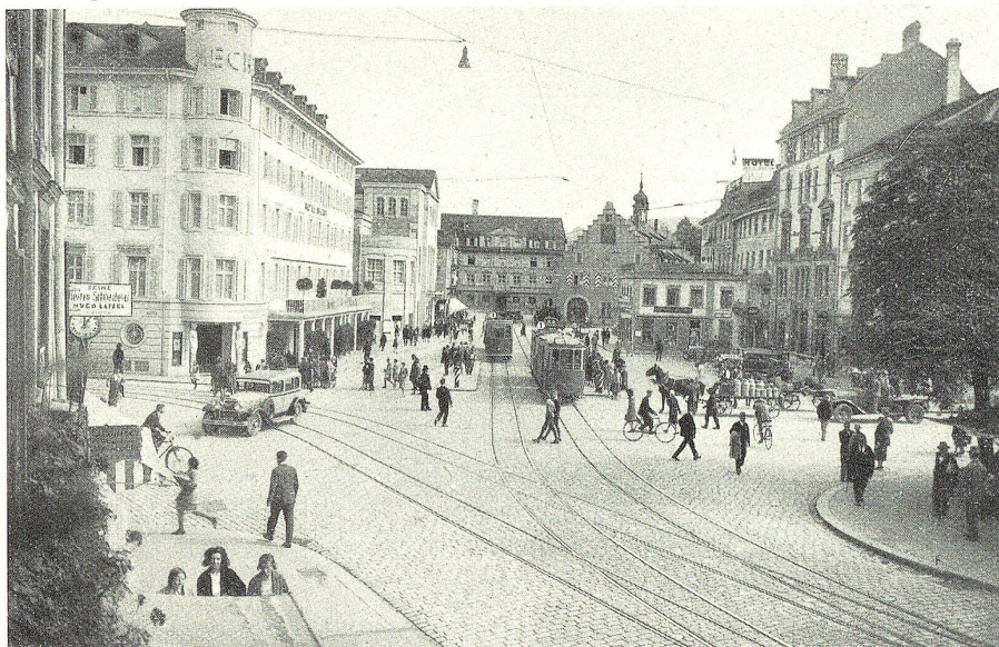
Der Marktplatz in St. Gallen

REDIGIERT UND HERAUSGEGEBEN VON AUG. MÜLLER, ST. GALLEN