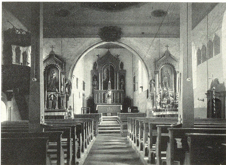
Innere der Kirche in St. Georgen.