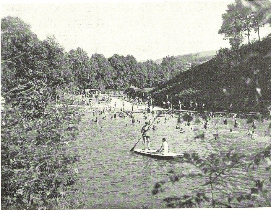
Das neue Trogener Schwimmbad

Weißer hindurch das Goldachwasser abgeleitet werden kann. Der Zufluß des ganzen Baches würde die Badetemperatur auch im Sommer zu tief halten; so aber kann dem Weißer selber eine regulierbare Menge Frischwasser zugeführt und bei Regenwetter vermieden werden, daß das dann trübe Wasser den Weißer verschlammte. Die ganze Anlage, welche Vielen willkommene Arbeit brachte, ist in drei Monaten erstellt worden. Bei den Bauarbeiten sind nicht nur