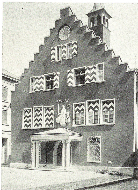
Rathaus in Rheineck

Am 3. März 1798 wurde das Rheintal von der Tagsatzung als freie eigene Landschaft erklärt, und am 1. Oktober zogen die Franzosen in Rheineck ein. Am Auffahrtstag 1799 mußten sie aber nach der für sie unglücklich verlaufenen Schlacht bei Feldkirch den nachrückenden Österreichern das Städtchen überlassen. Nach der zweiten Schlacht bei Zürich fluteten die geschlagenen Russen und Österreicher über den Rhein, und wieder am 1. Oktober marschierten